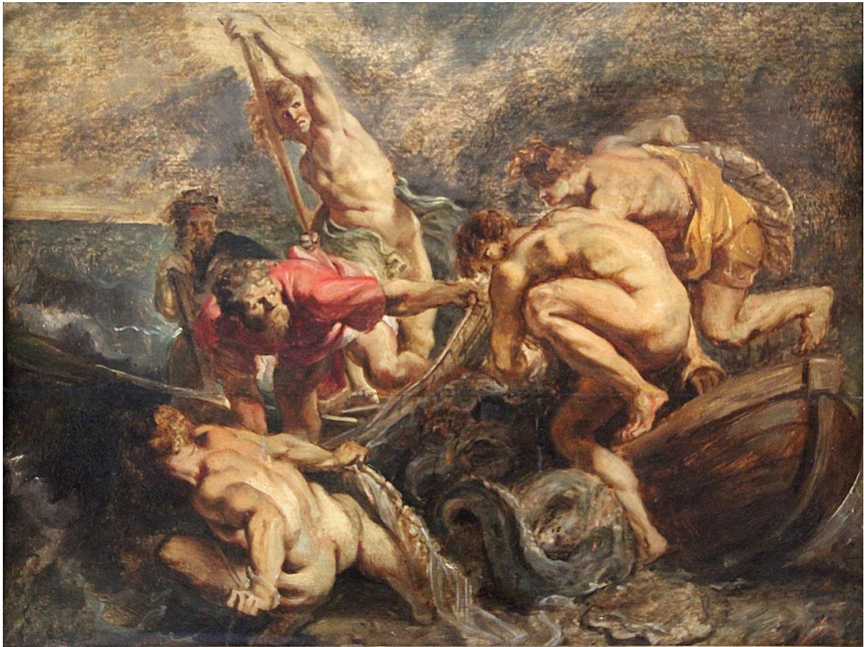
De wonderbare visvangst, Peter Paul Rubens