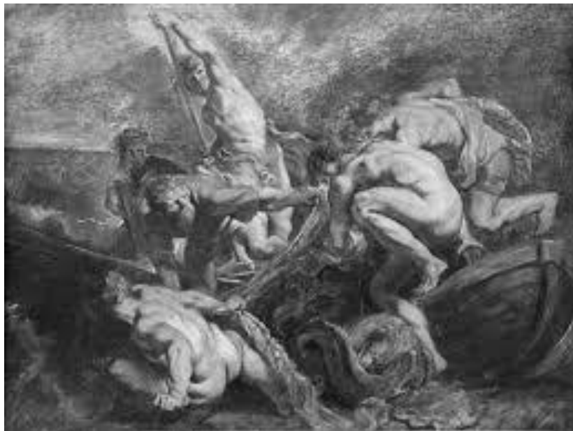
De wonderbare visvangst (Peter Paul Rubens)